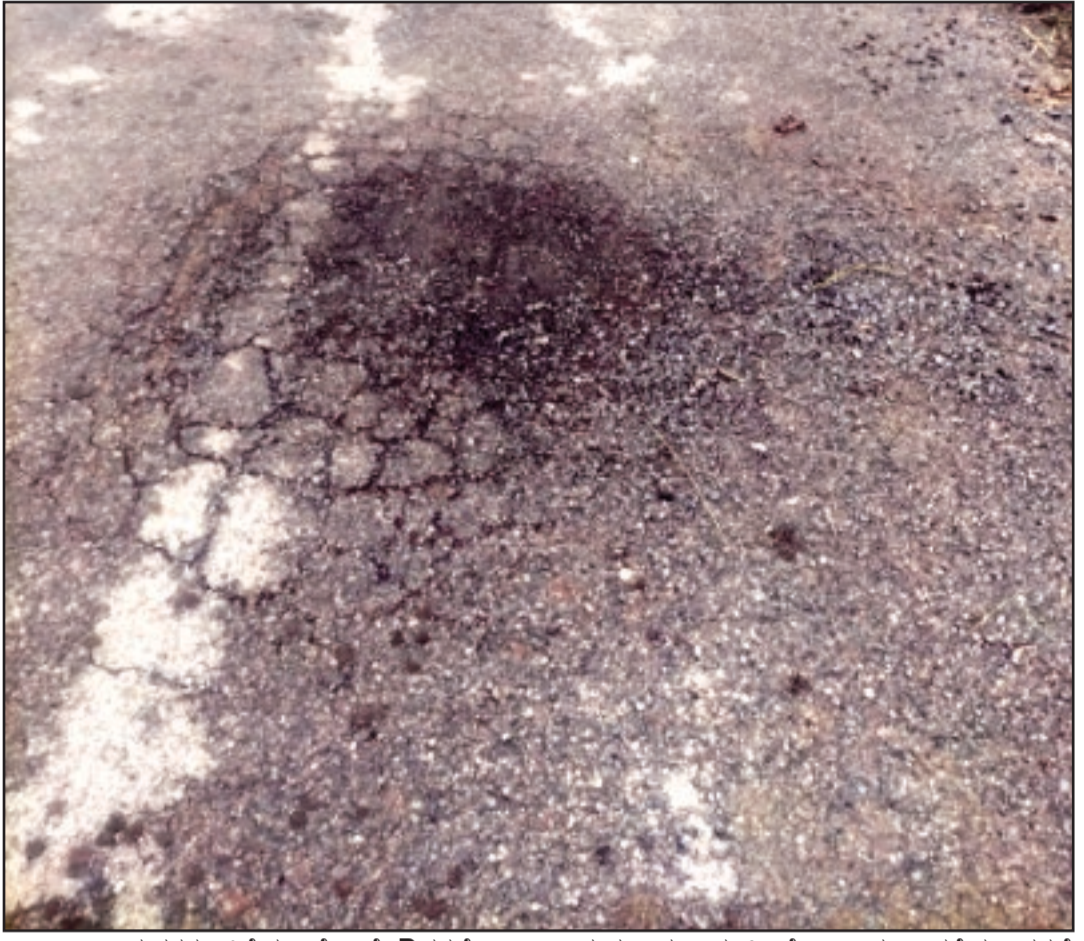
ರಾಮನಗರ ಜಿಲ್ಲೆಯ ಹೊಂಬೇಗೌಡನದೊಡ್ಡಿ ಗ್ರಾಮದ ಕೂಟಗಲ್ ಹೋಬಳಿಯ ರಸ್ತೆಯು ಕಳಪೆ ಕಾಮಗಾರಿಯಿಂದ ಆಗಿದೆ ಎಂದು ಸಾರ್ವಜನಿಕರು ಆಕ್ರೋಶ ವ್ಯಕ್ತಪಡಿಸಿದ್ದಾರೆ ತಕ್ಷಣ ಕ್ರಮ ತೆಗೆದುಕೊಳ್ಳಬೇಕಾಗಿ ವಿನಂತಿ.