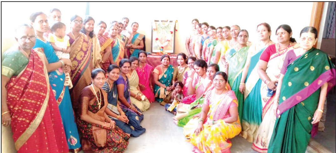
ಸೈದಾಪುರ : ಪಟ್ಟಣದ ವಾಸವಿ ವಿದ್ಯಾ ಸಂಸ್ಥೆಯಲ್ಲಿ ಆರ್ಯ ವೈಶ್ಯ ಮಹಿಳಾ ಸಂಘದಿಂದ ವಾಸವಿ ಕನ್ನಿಕಾ ಪರಮೇಶ್ವರಿ ಅಗ್ನಿ ಪ್ರವೇಶ ದಿನದ ಪ್ರಯುಕ್ತ ವಿಶೇಷ ಪೂಜೆಯ ಸಲ್ಲಿಸಲಾಯಿತು.